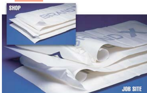
※搬送時のトンネルも・・・

RLA (Release Liner Adhesive) 付アプリケーションテープは 離型紙のシリコン側にもしっかりと粘着する為、 搬送時のトンネルが起きにくく、 またカールしにくい、ユニークかつ非常に使いやすい製品で 世界のアプリケーションテープの標準となっています。